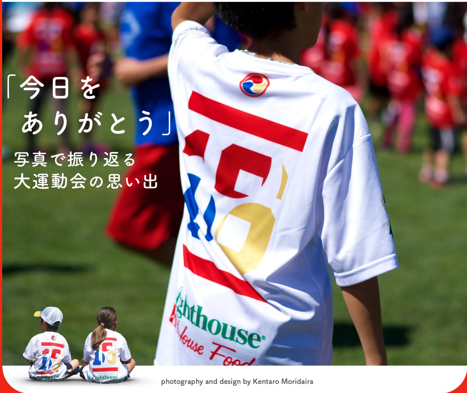
photography and design by Kentaro Moridaira