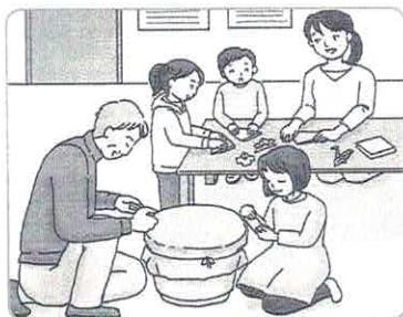
「あすばる」での活動の様子