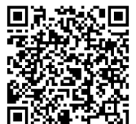
グリーンスクリーンQR