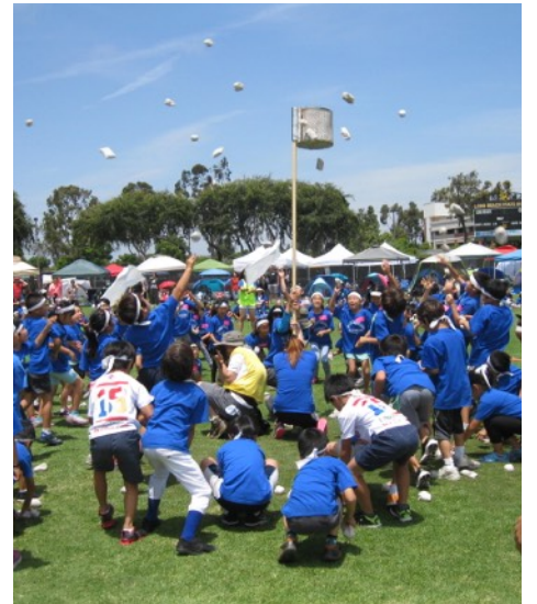
ダンシング玉入れ