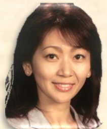
なつこえんちょう せんせい

→親子でおりがみ…幼稚園の子どもたちにとって、どんな遊びよりパパママと一緒に遊ぶ事が特別な喜びです！ 折り紙は手先を器用にし、集中力、想像力を鍛え、脳にも非常に良いとされています。日本の文化「おりがみ」を親子で楽しみませんか？