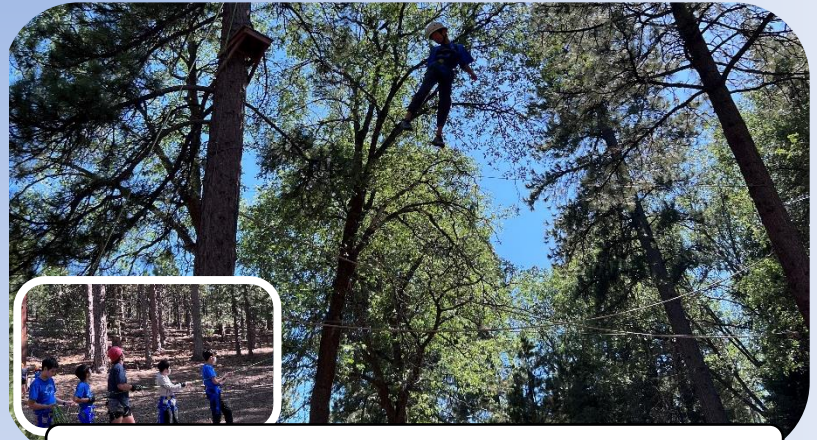
=仲間を信じて、ハイロープ=

目玉のアクティビティの1つでもあるハイロープは、高さ14mの木登り、そしてそこからジャンプ。安全ロープはカウンセラーと共に子どもたちも一緒に支えます。ほかにも、綱渡りやボルダリングなど、スリルとチャレンジが満載でした。特に、他者を励ましたり、アドバイスをしたり、高所が苦手な子には無理をさせない雰囲気を作ったりと、NAC生、最高です。