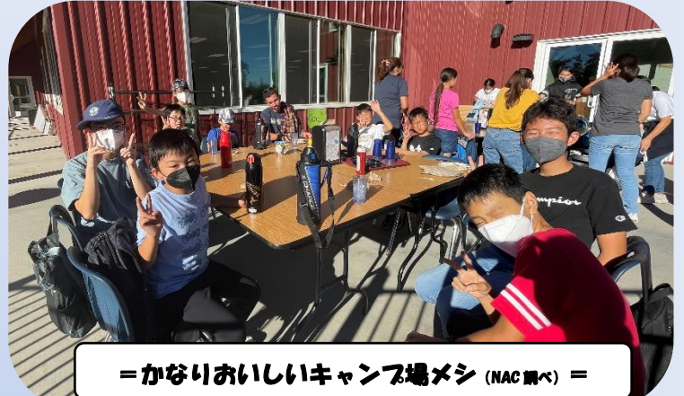
=かなりおいしいキャンプ場メシ (NAC 調べ) =