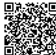
グリーンスクリーンQR