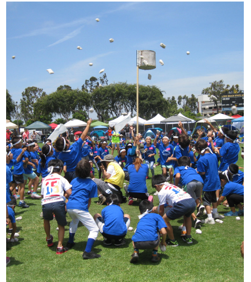
ダンシング玉入れ