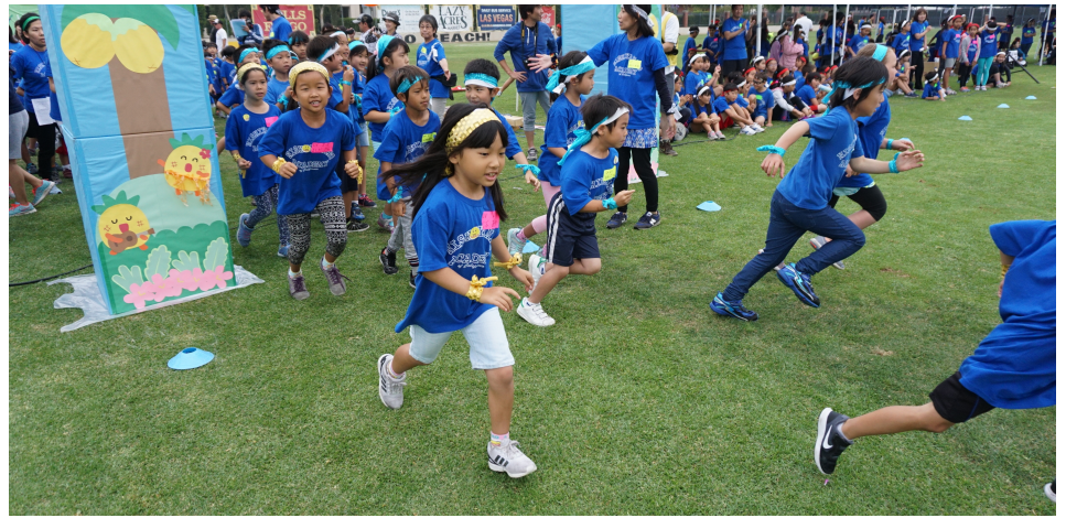
にんじやりばんばん