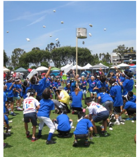
ダンシング玉入れ