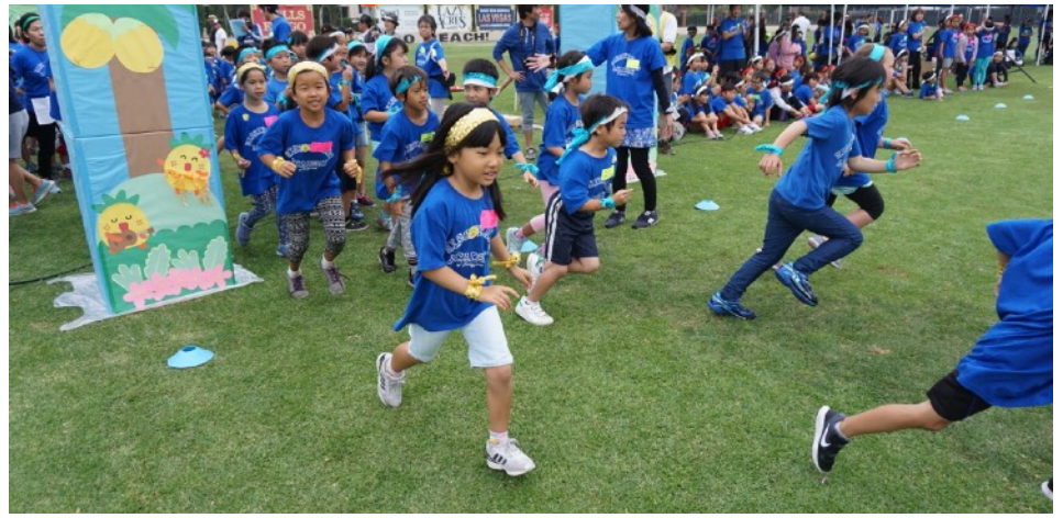
にんじやりばんばん