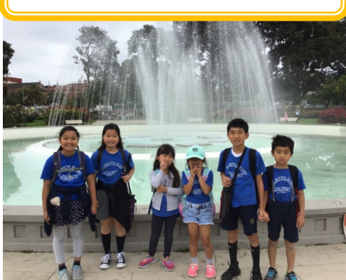
The Galaxy Group