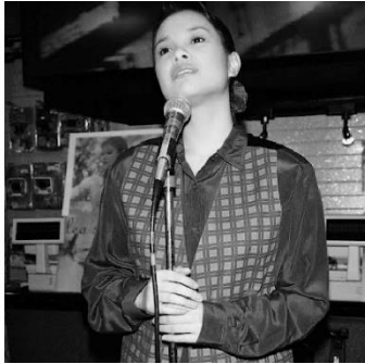
Maria Lea Carmen Imutan Salonga Salonga is a Filipina singer, actress, producer, and columnist. Dubbed the "Pride of the Philippines" She is best known as the singing voices of Disney's Jasmine and Mulan.

From veterans to Tony award winners, from labor movement leaders to gold medalists, we invite you to discover the rich and diverse stories, people and history of Filipino American culture.