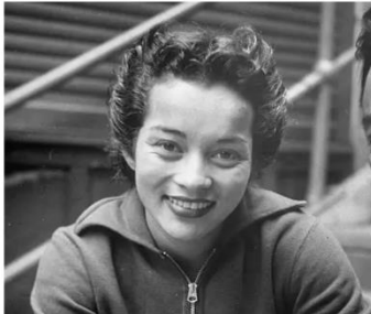
Victoria Manalo Draves Victoria Manalo Draves was a Filipino American competitive diver who won gold medals in both platform and springboard diving at the 1948 Summer Olympics in London.