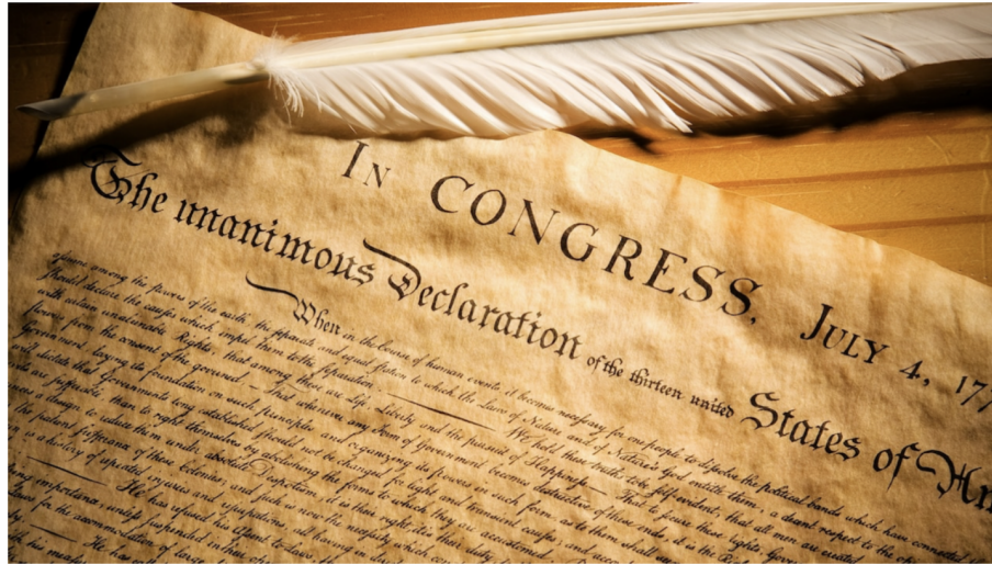
The Declaration of Independence

The Fourth of July, also called "Independence Day", is the American holiday marking the historic date in 1776, when the Continental Congress approved and signed the Declaration of Independence. This document stated that American colonies would be free from the rule of Great Britain. They would become their own country.