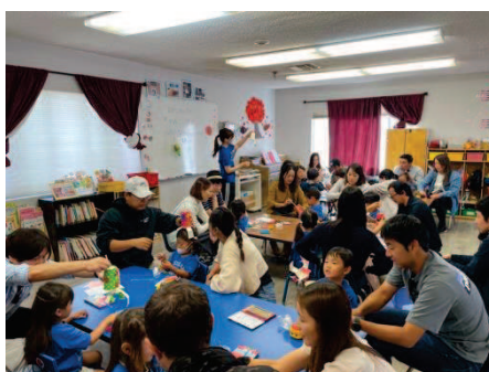
年少ちゅうちょ組 「親子制作」