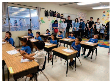
年長ひまわり組 「表現・感謝の気持ち」