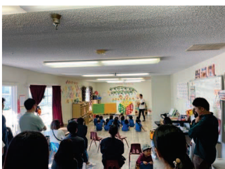
年中たんぽぽ組 「食育」